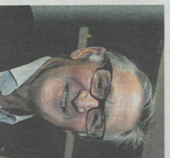
2 QUESTIONS À... PHILIP JENNINGS PERSONNALITÉ LA CÔTE DE LA DÉCENNIE